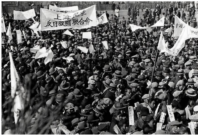
“一二·九”运动得到全国人民的响应