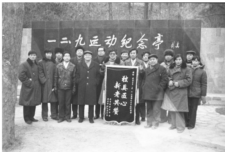
“一二·九”运动纪念亭落成典礼上，主管部门向承担纪念亭设计任务的我校师生颁发了奖