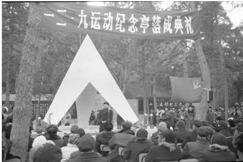
1985年“一二·九”运动纪念亭落成典礼现场，图为时任中央书记处书记邓力群发表讲话。

1985年12月9日，“一二·九”运动纪念亭落成典礼在北京香山樱桃沟举办。时任中央书记处书记邓力群、中纪委书记韩天石等60多名“一二·九”运动时期的老同志和北京市委、市政府的负责同志以及首都200多名大学生出席了落成典礼。作为纪念亭的设计者，我校被团市委、市学联授予奖旗。旗上所书“独具匠心，老少共赞”集中表达了新老两代人对这座永久性建筑物的评价，是对我校集体智慧与努力付出的肯定与嘉奖。