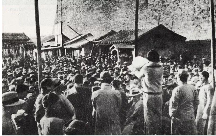
“一二·九”运动中清华学生在街头演讲