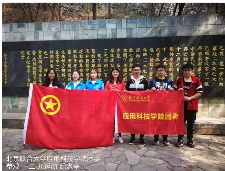
北京联合大学应用科技学院团委 参观“一二·九”运动纪念亭