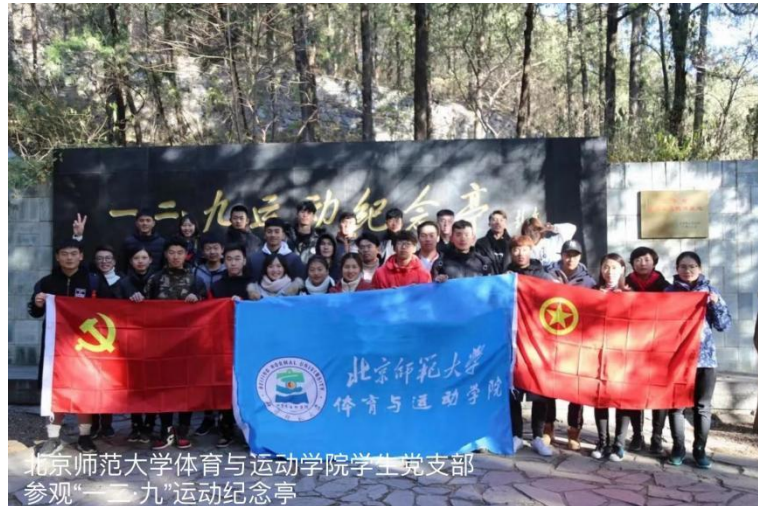
北京师范大学体育与运动学院学生党支部 参观“一二·九”运动纪念亭